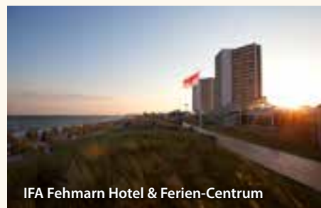
IFA Fehmarn Hotel & Ferien-Centrum

IFA Fehmarn Hotel & Ferien-Centrum – Burg: Direkt am Strand, ca. 4 km bis ins Zentrum (Bushaltestelle ca. 150 m vom Hotel), Ferienanlage bestehend aus Fernblickhäusern mit Lift, Restaurants, Bars, Cafés und Terrassen, großer Wintergarten, Zimmer mit Bad oder DU/WC, Fön, Sat-TV, Telefon, WLAN, Balkon und Meerblick.