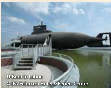
U-Boot in Laboe

Über Heiligenhafen, Oldenburg, Lütjenburg, vorbei am Selenter See, geht es nach Kiel. Bei einer Rundfahrt durch die schleswig-holsteinische Landeshauptstadt zeigt Ihnen der Stadtführer den Kieler Hafen, das Rathaus, das Kieler Schloss und vieles mehr. Selbstverständlich ist auch genügend Zeit für einen Bummel durch die Kieler Innenstadt und den Sophienhof. Auf der Rückfahrt ist ein Stopp im Ostseebad Laboe geplant. Hier haben Sie die Möglichkeit das Marineehrenmal und das U-Boot zu besichtigen (Eintritt Extrakosten).