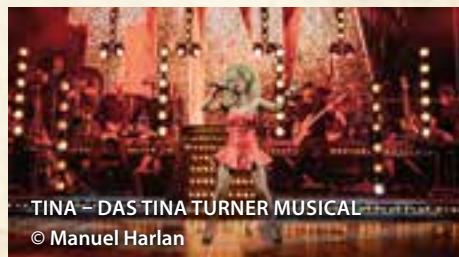
TINA – DAS TINA TURNER MUSICAL