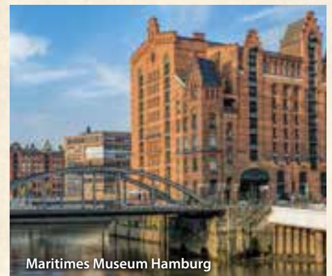
Maritimes Museum Hamburg

Heute heißt es früh aufstehen, damit Sie noch rechtzeitig zum beliebten Fischmarkt kommen. Anschließend beginnt Ihre Stadtrundfahrt. Sie besuchen die Alt- und Neustadt mit dem Jungfernstieg, dem Rathausmarkt, der Börse und der St. Michaeliskirche, deren Turm das Wahrzeichen Hamburgs ist. Die Kramer-Amtswohnungen, St. Pauli und die Speicherstadt bleiben Ihnen natürlich nicht vorenthalten. Im Anschluss haben Sie noch die Möglichkeit zu einer Hafensrundfahrt (Extrakosten). Anschließend treten Sie vorbei an Hannover Ihre Rückreise an.