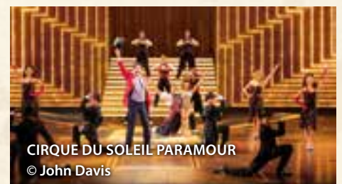
CIRQUE DU SOLEIL PARAMOUR © John Davis