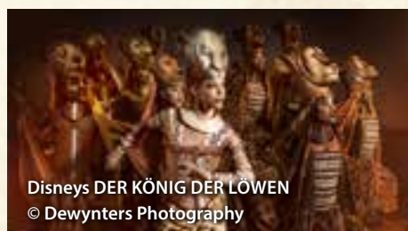
Disneys DER KÖNIG DER LÖWEN

Vorbei an Leipzig starten Sie am frühen Morgen nach Hamburg. Am Nachmittag steht der Besuch Ihres Wunsch-Musicals auf dem Programm. Genießen Sie die Emotionen, große Schauspielkunst, prächtigen Kostüme sowie wundervolle Musik und lassen Sie sich verzaubern in der Welt der Musicals. Nach dem Ende der Vorstellung erfolgt die gemeinsame Fahrt in Ihr Hotel im südlichen Raum von Hamburg.