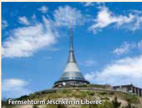
Fernsehturm Jeschken in Liberec

Nach dem Frühstück starten Sie zur einer Dreiländerfahrt. Sudeten-, Iser- und Riesengebirge, eine von Polen und Tschechien übergreifende Berglandschaft und mittendrin so bekannte Ort wie Jelenia Gora (Hirschberg) und Liberec (Reichenberg) mit zahlreichen Sehenswürdigkeiten werden Sie begeistern. Zum Abschluss des Tages sind Sie im Hotel zu einem rustikalen Spanferkelessen mit großem Schlachtebuffet, gewürzt mit vielen Anekdoten zum Schweinschlachten und gemütlichem Tanzabend, eingeladen.