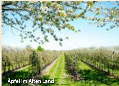
Äpfel im Alten Land

Ihre Reise beginnt am Morgen. Vorbei an Hannover erreichen Sie die Lüneburger Heide. Ab hier beginnt Ihr Naturerlebnis pur. Spazieren Sie durch den Naturschutzpark, genießen Sie die Heidelandschaft oder unternehmen Sie eine Kutschfahrt (Extrakosten). Im Anschluss fahren Sie weiter in Ihr Hotel in den südlichen Raum von Hamburg, wo Sie herzlich empfangen werden.