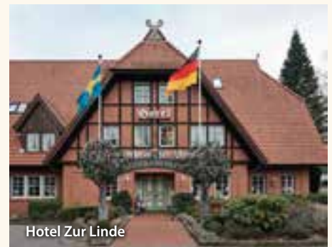
Hotel Zur Linde

Hotel Zur Linde – Seevetal-Hittfeld: Gemütliches Familienhotel im südlichen Raum von Hamburg gelegen, Restaurant, Außenbereich mit Biergarten, liebevoll eingerichtete Zimmer mit DU/WC, TV, Telefon und WLAN.