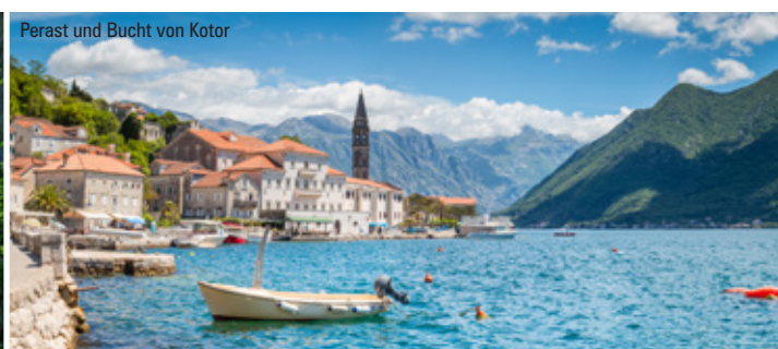
Perast und Bucht von Kotor