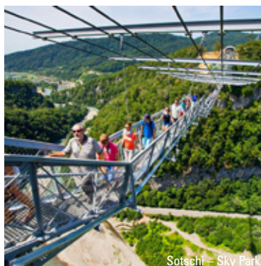
Sotschi – Sky Park

Hinweise: Reisepass erforderlich, welcher über das Reiseende hinaus noch 6 Monate gültig ist. Sie benötigen für die Einreise ein Visum und eine in Russland gültige Krankenversicherung. Sonstige Eintrittsgelder sind nicht im Reisepreis enthalten. MTZ: 20 bei einer Absagefrist bis 4 Wochen vor Reisebeginn.