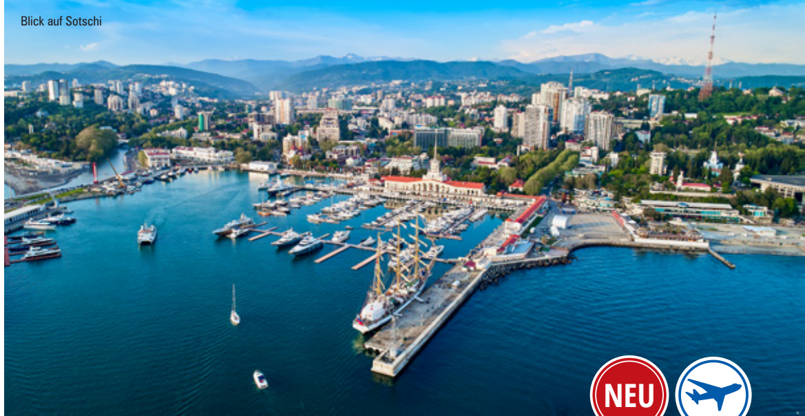
Blick auf Sotschi