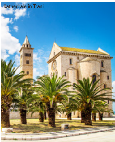
Kathedrale in Trani

Nach erlebnisreichen Tagen fliegen Sie zurück nach Berlin.