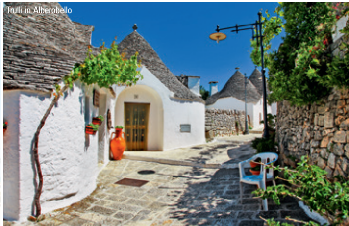
Trulli in Alberobello