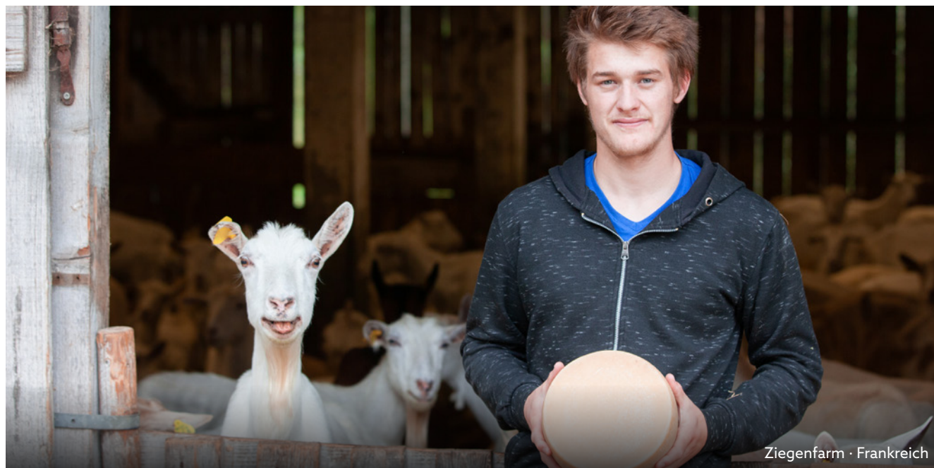
Ziegenfarm • Frankreich

Weitere Informationen zur BIJOU DU RHÔNE und zu der nicko cruises Flotte finden Sie unter: www.nicko-cruises.de/flussschiffe