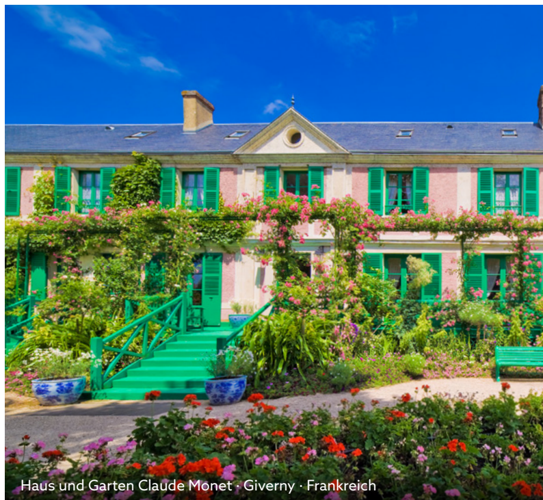
Haus und Garten Claude Monet · Giverny · Frankreich