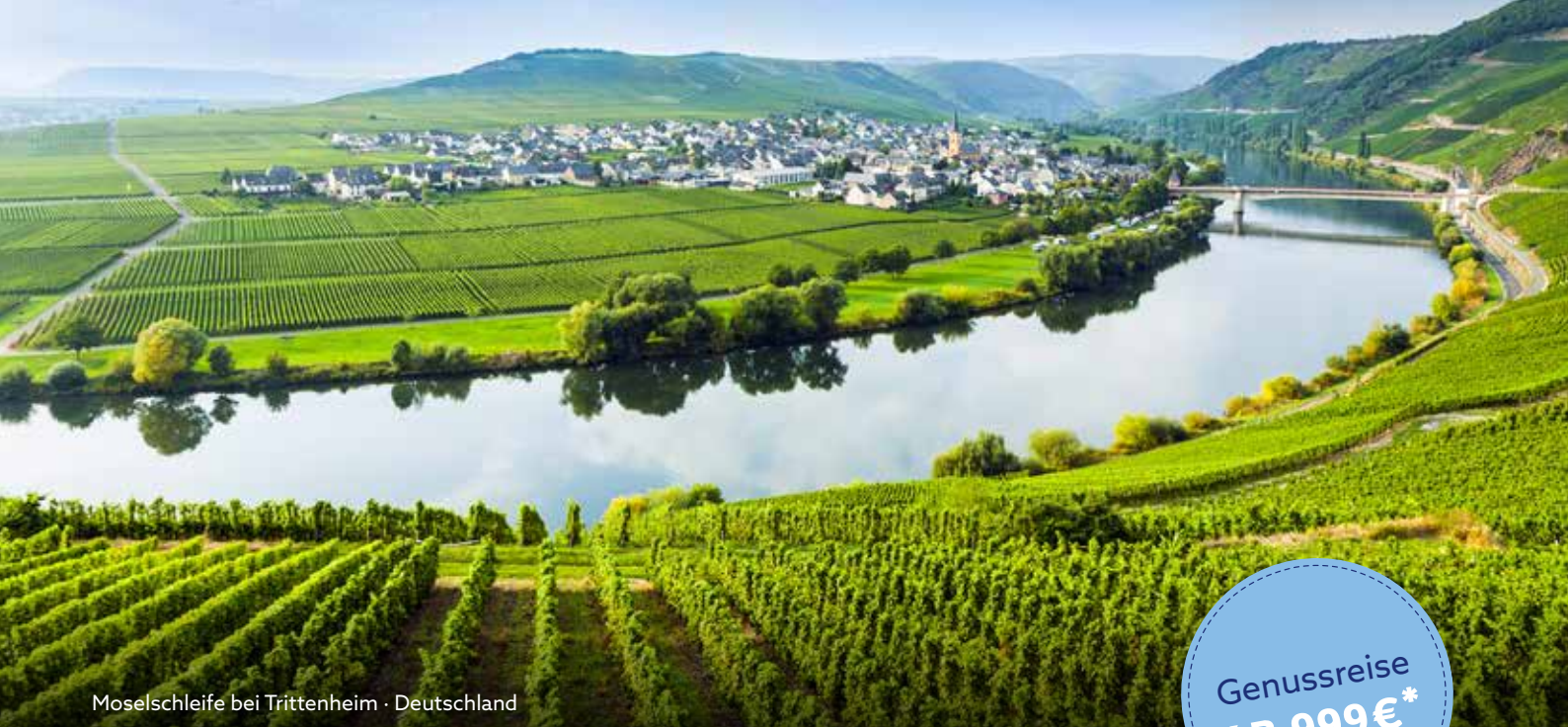
Moselschleife bei Trittenheim · Deutschland