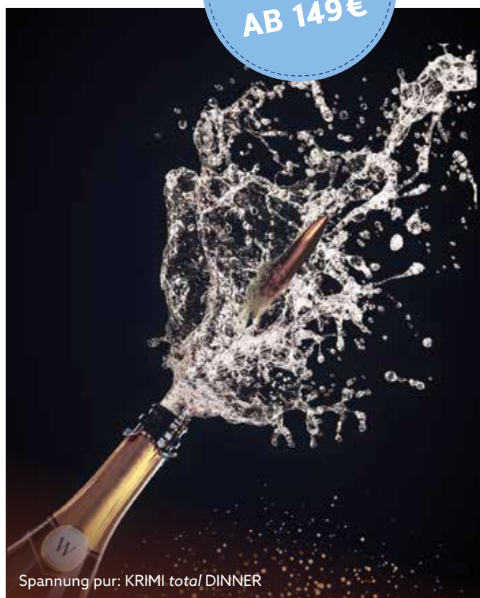
Spannung pur: KRIMI total DINNER