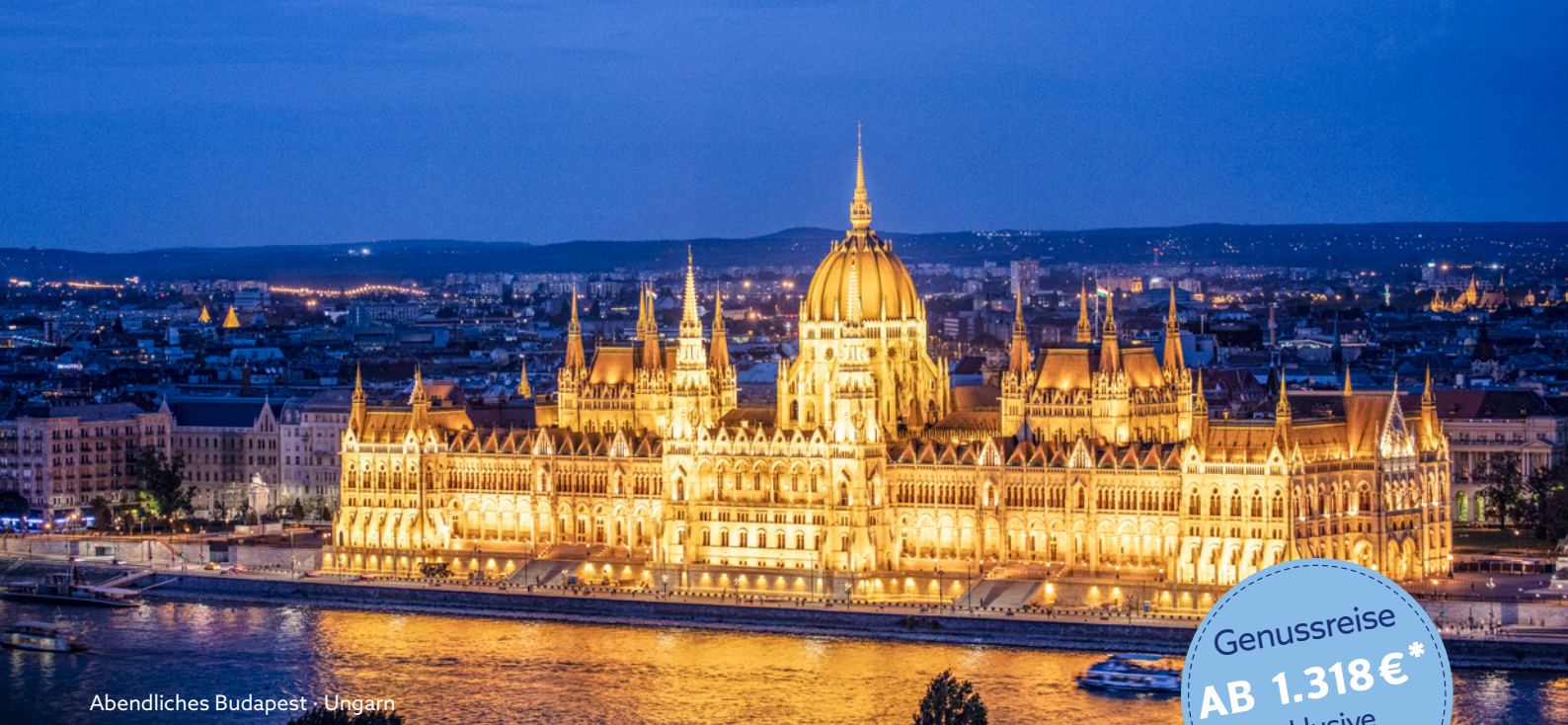
Abendliches Budapest · Ungarn

Genussreise AB 1.318€* inklusive Ausflugspaket