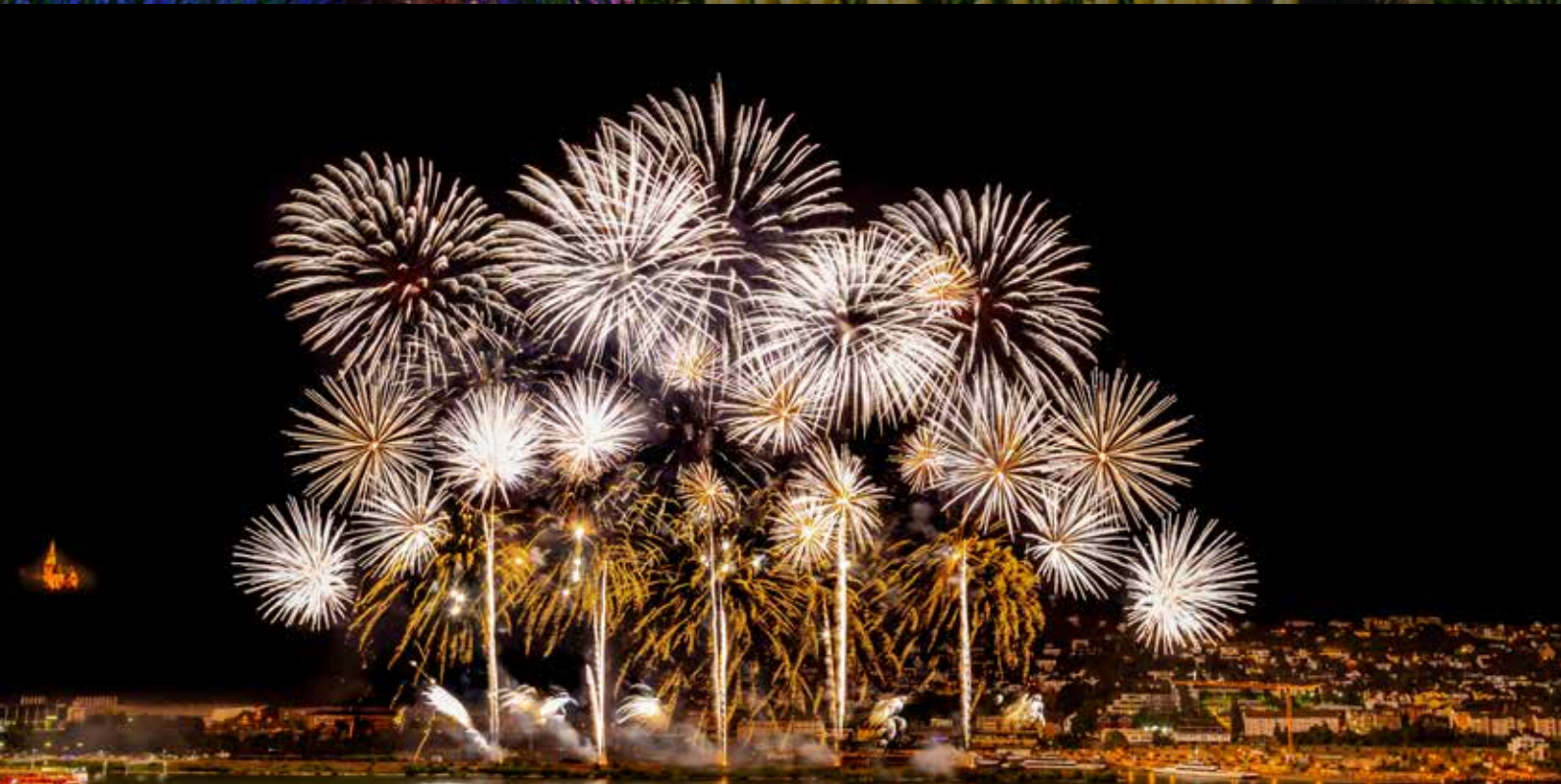
6 | Rhein in Flammen · Deutschland