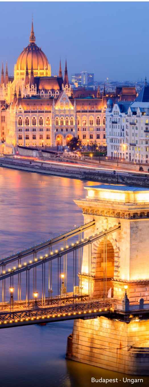
Budapest · Ungarn