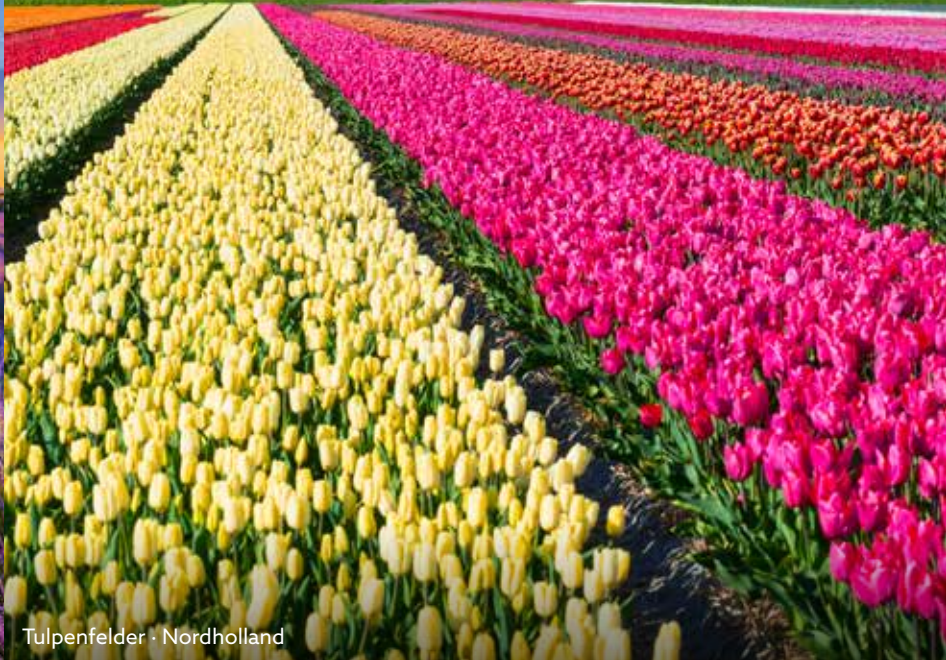
Tulpenfelder · Nordholland