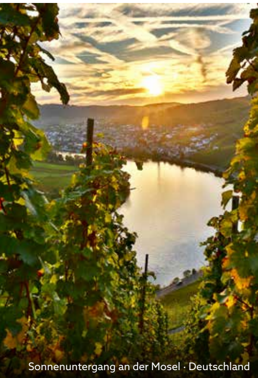
Sonnenuntergang an der Mosel · Deutschland