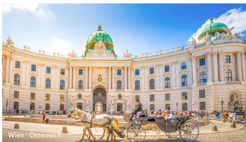
Wien · Österreich