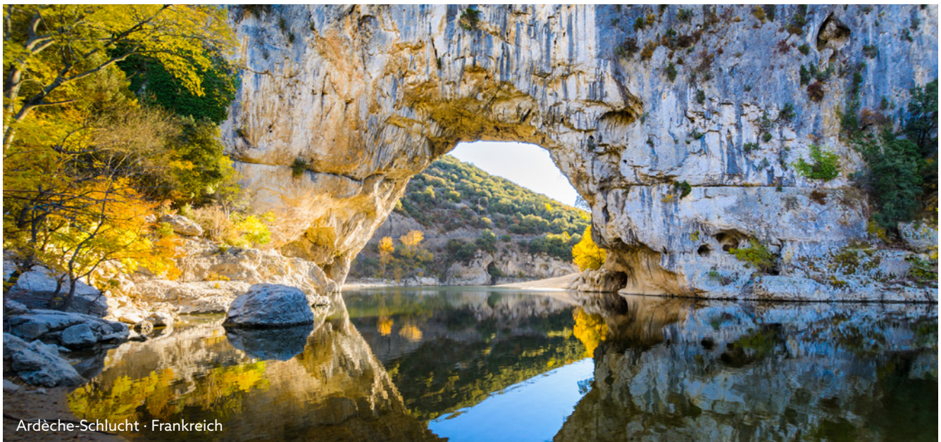
Ardèche-Schlucht · Frankreich