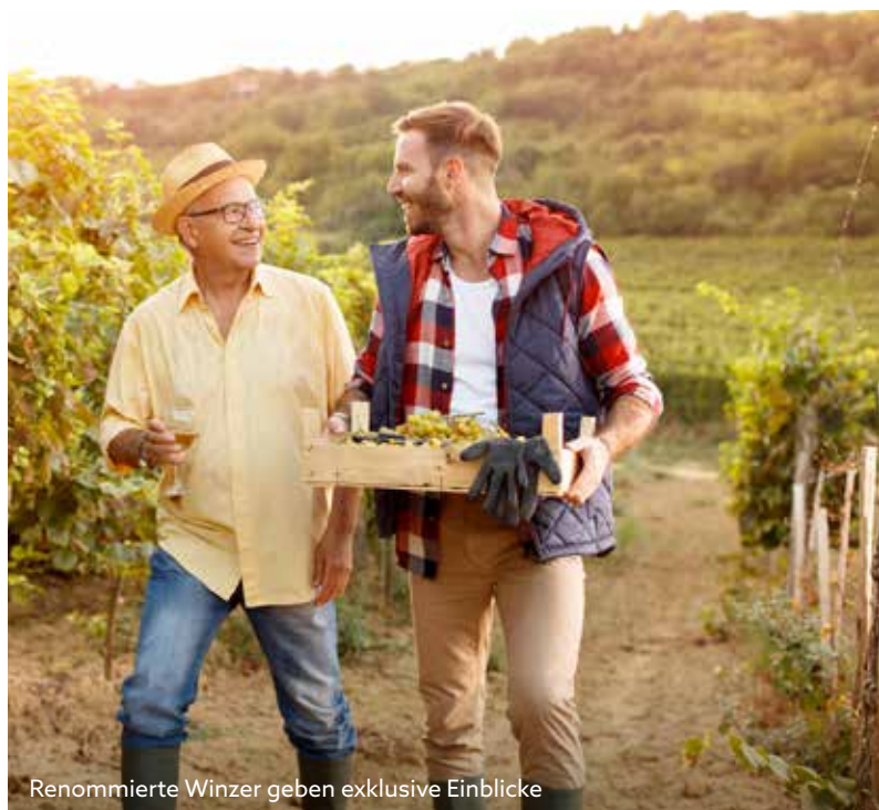
Renommierte Winzer geben exklusive Einblicke