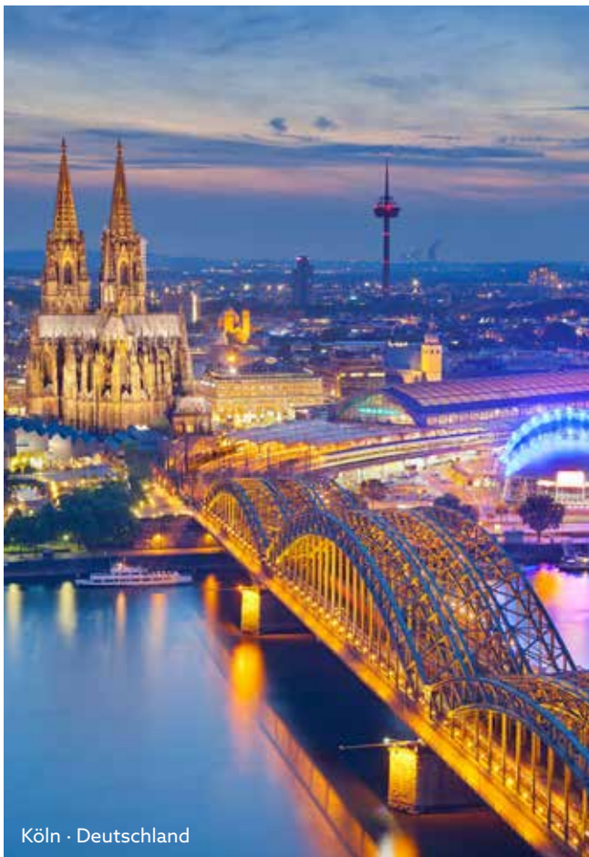
Köln • Deutschland

Sie möchten mehr über unser KRIMI total/ DINNER erfahren? Scannen Sie jetzt den QR-Code oder informieren Sie sich unter www.nicko-cruises.de/eventreisen über unsere einzigartigen Eventreisen auf dem Fluss.