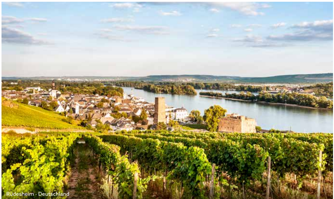
Rudesheim · Deutschland