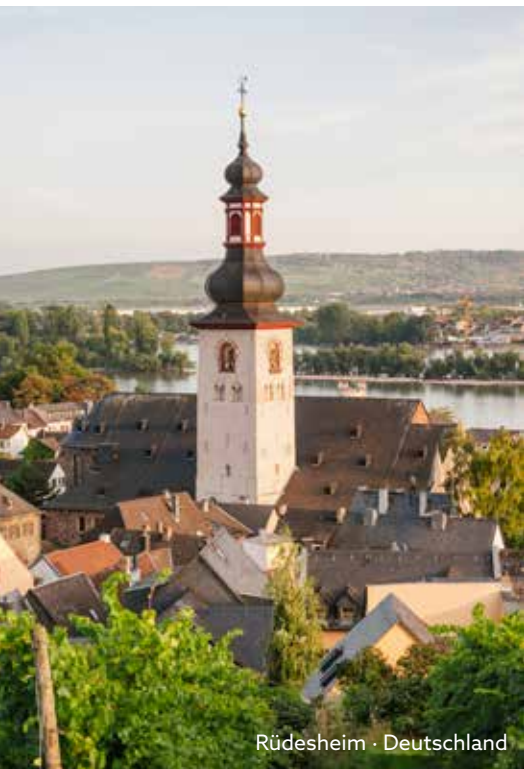
Rudesheim · Deutschland