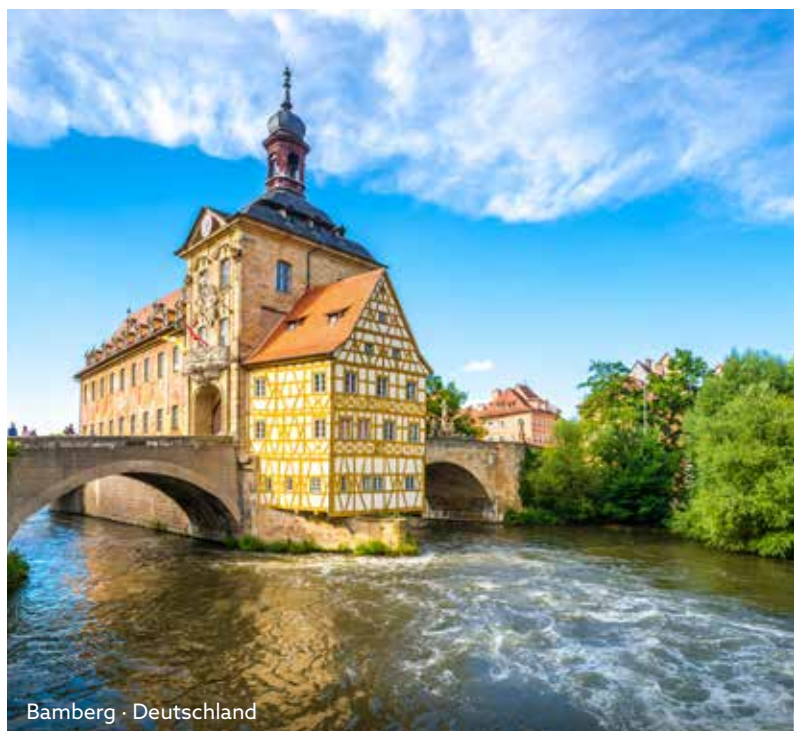
Bamberg · Deutschland