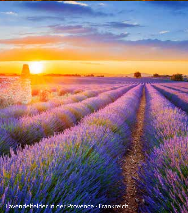
Lavendelfelder in der Provence · Frankreich