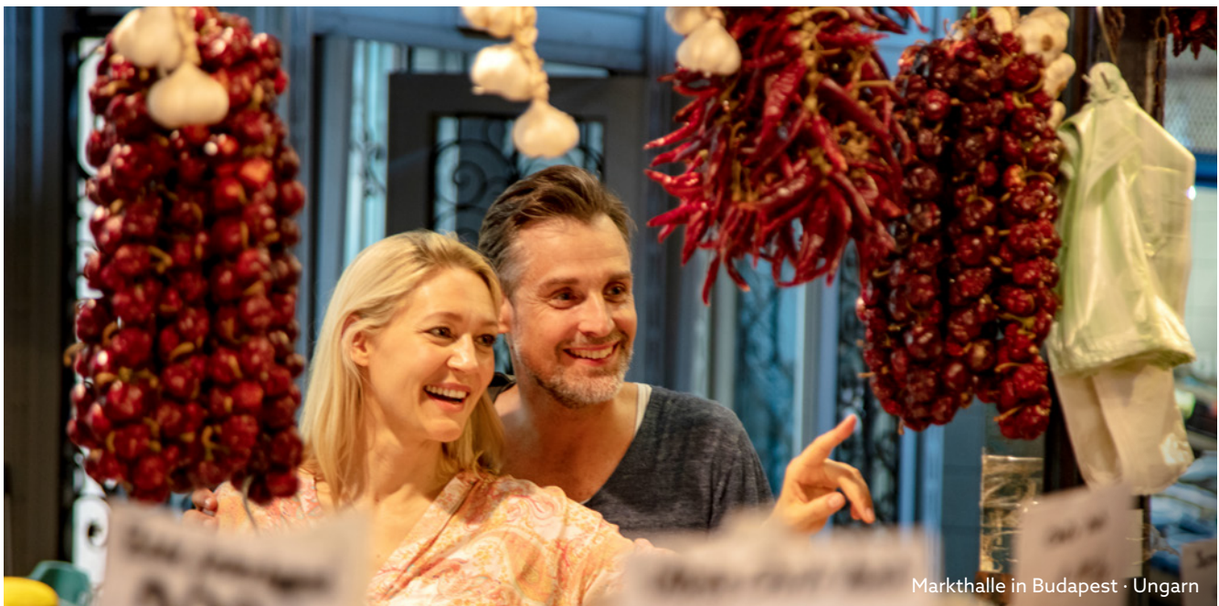
Markthalle in Budapest · Ungarn