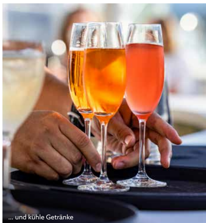
... und kühle Getränke