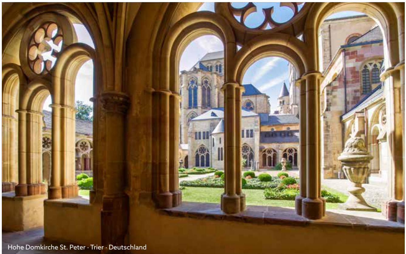
Hohe Domkirche St. Peter · Trier · Deutschland