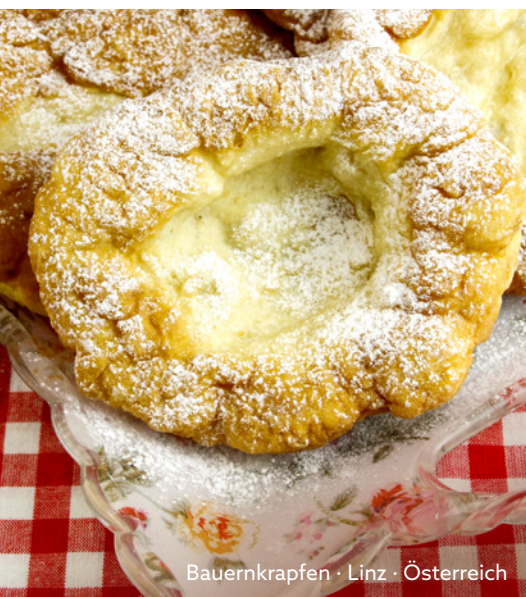
Bauernkrapfen · Linz · Österreich