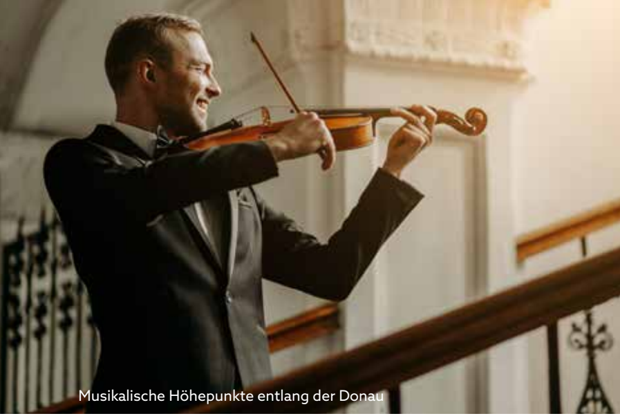
Musikalische Höhepunkte entlang der Donau