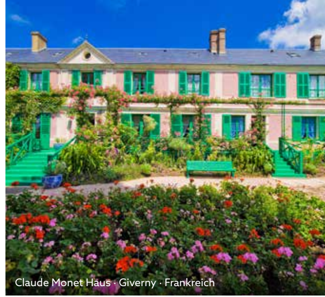
Claude Monet Haus · Giverny · Frankreich

spüren. Entlang der Rhône führen wir Sie zu den kulinarisch aufregendsten Orten Frankreichs. Sie erfahren, wie der traditionelle Cassis hergestellt wird, besuchen ein Landgut mit eigener Ziegenfarm und entdecken die atemberaubende Ardèche-Schlucht mit ihren majestätischen Steilhängen.