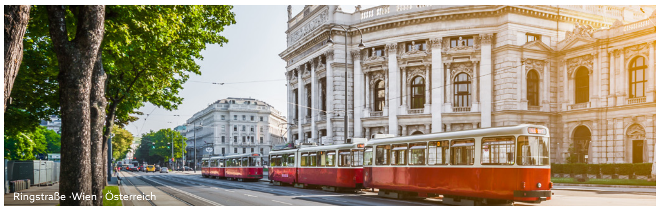
Ringstraße · Wien · Österreich

Weitere Informationen zur CELINA und zu der nicko cruises Flotte finden Sie unter: www.nicko-cruises.de/flussschiffe