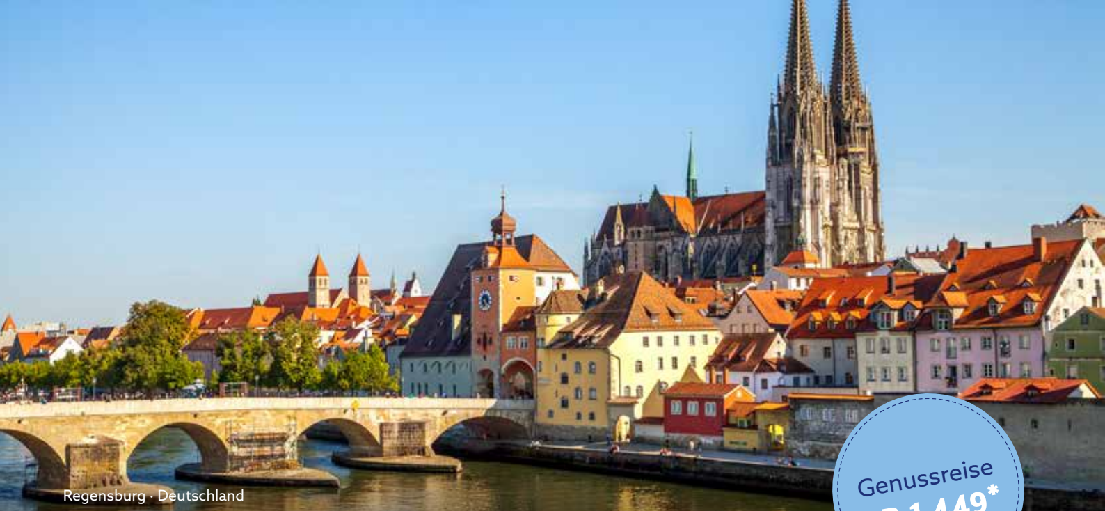
Regensburg · Deutschland