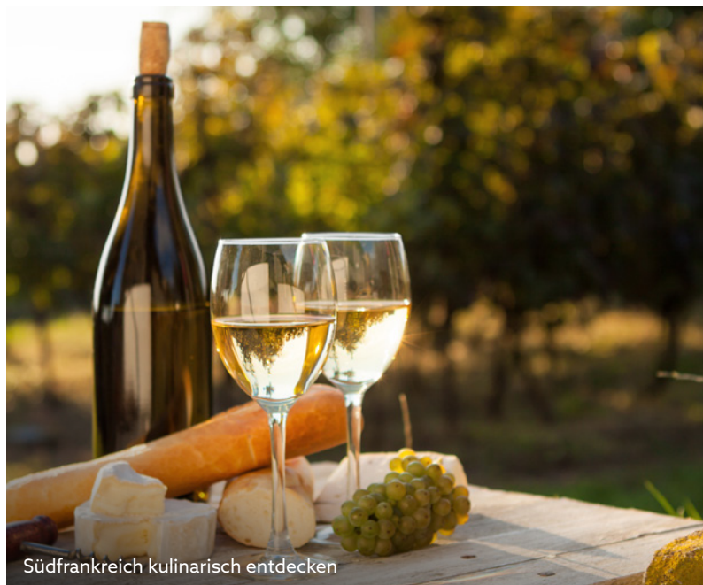
Südfrankreich kulinarisch entdecken