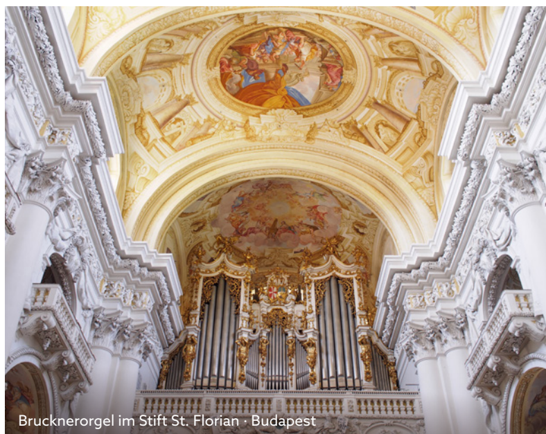
Brucknerorgel im Stift St. Florian · Budapest