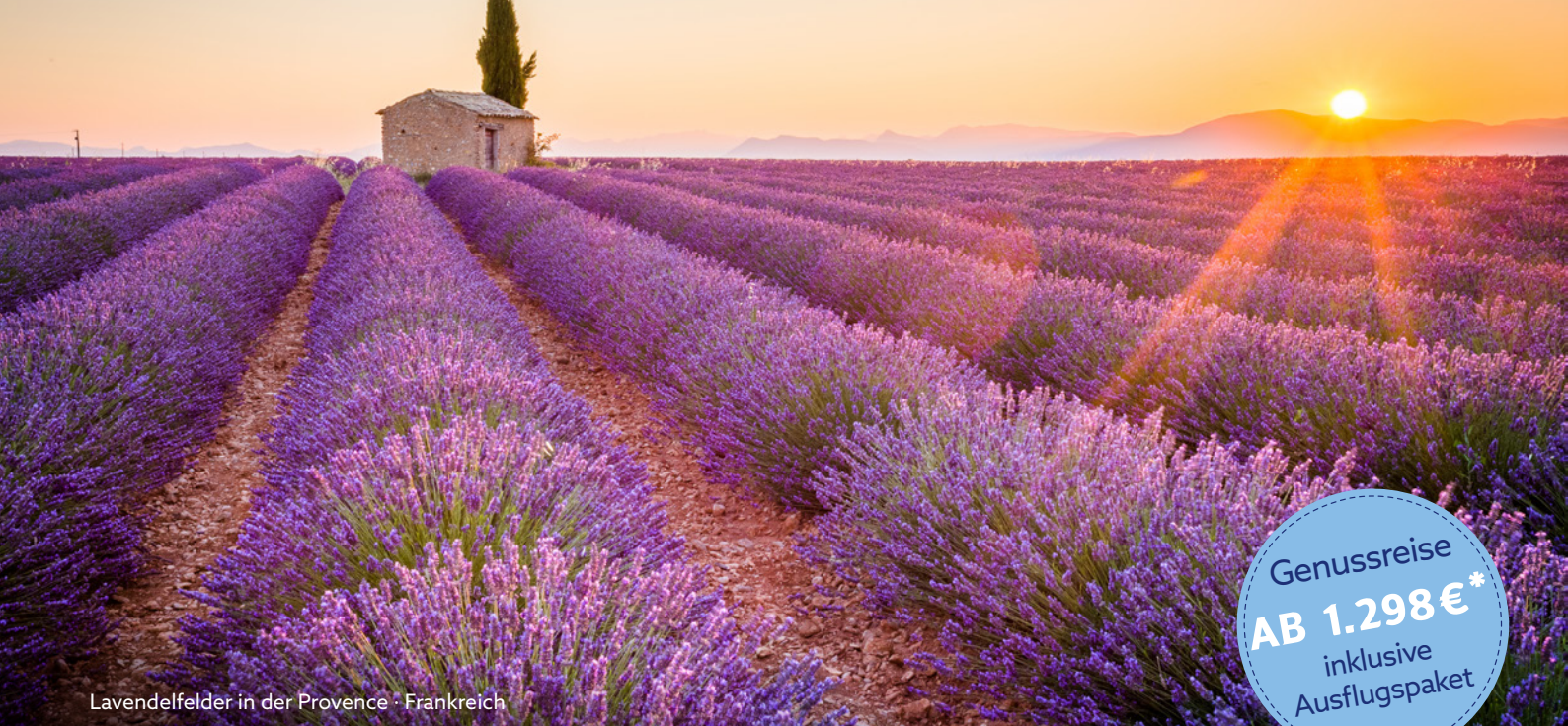
Lavendelfelder in der Provence · Frankreich

Genussreise AB 1.298€* inklusive Ausflugs paket