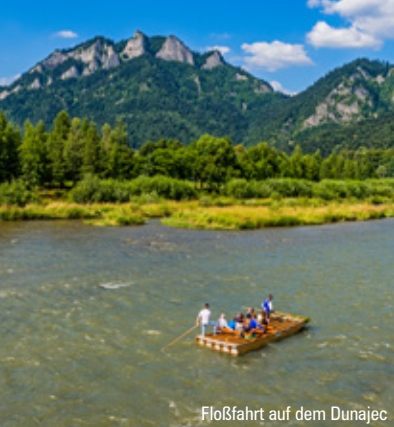
Floßfahrt auf dem Dunajec