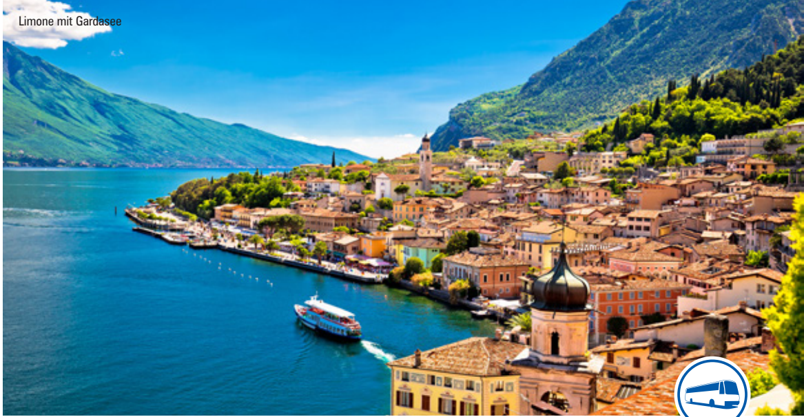
Limone mit Gardasee