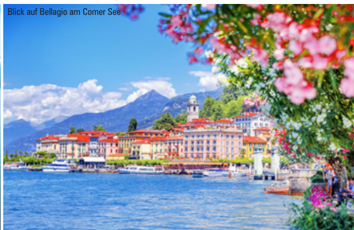
Blick auf Bellagio am Comer See