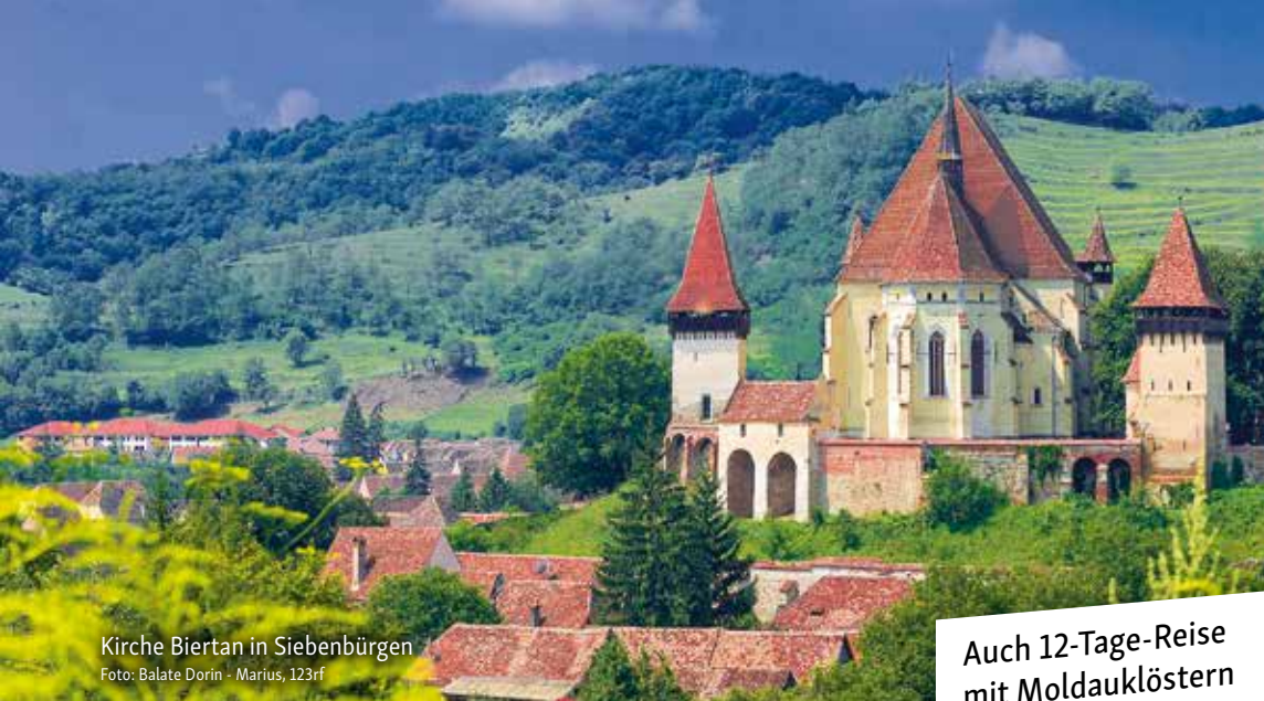
Kirche Biertan in Siebenbürgen