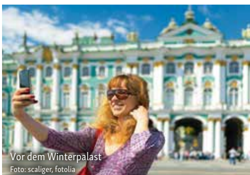
Vor dem Winterpalast

Nach einer Woche packender Erlebnisse hat sich Ihnen die russische Seele ein Stück weit enthüllt. Do swidaniya!