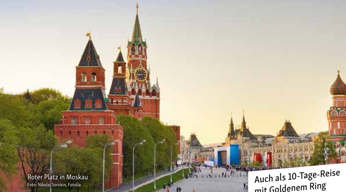
Roter Platz in Moskau

Auch als 10-Tage-Reise mit Goldenem Ring