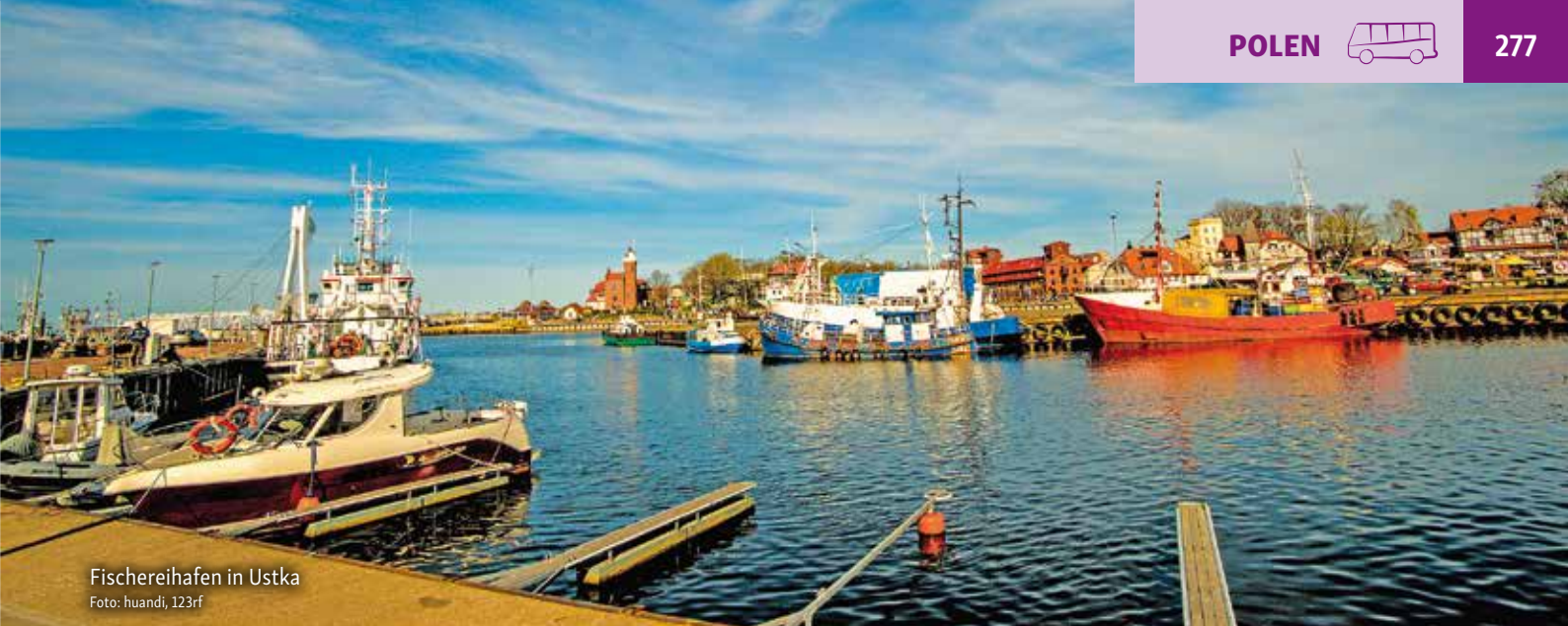
Fischereihafen in Ustka