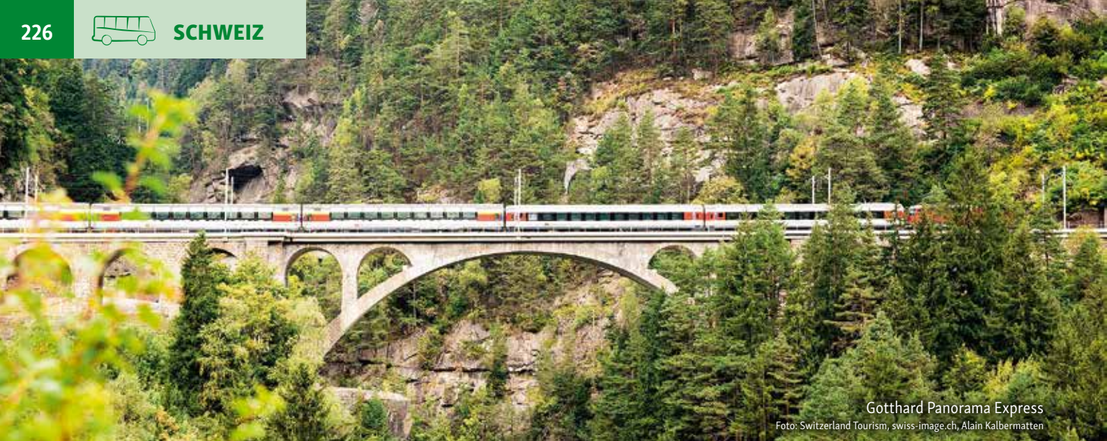
Gotthard Panorama Express