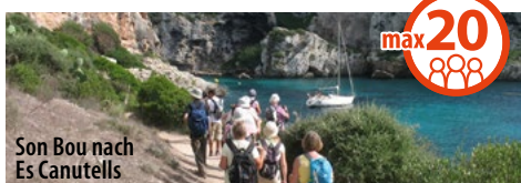
Son Bou nach Es Canutells

auch als Singlereise: Reisecode: GO-WABRE 17.08. – 27.08.2024