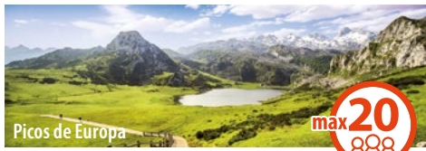
Picos de Europa