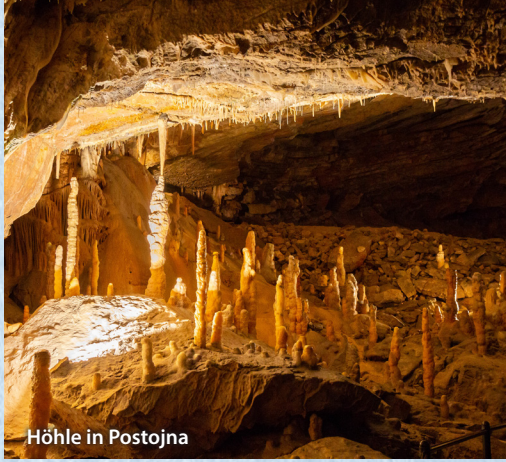
Höhle in Postojna

Genießen Sie den heutigen Tag in Ihrer Hotelanlage und nutzen Sie die vielfältigen Freizeiteinrichtungen. Für die Unermüdlichen empfehlen wir einen erlebnisreichen Schiffsausflug zur vorgelagerten Inselwelt der Kornati-Inseln mit Korallen und Schwammfischerei inklusive Mittagessen (Extrakosten 50 € p. P. – Voranmeldung bei Buchung).