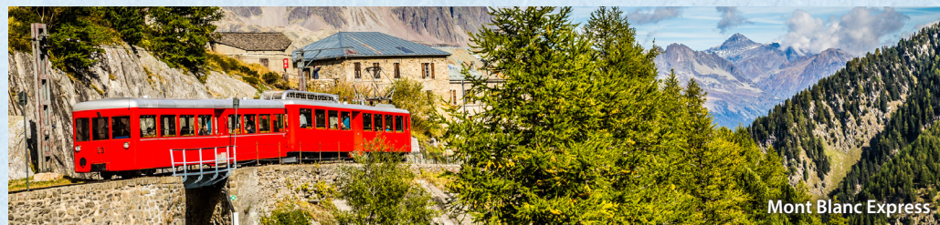
Mont Blanc Express

Nach einer geruhsamen Nacht und einem stärken-den Frühstück treten Sie heute die Rückreise an.