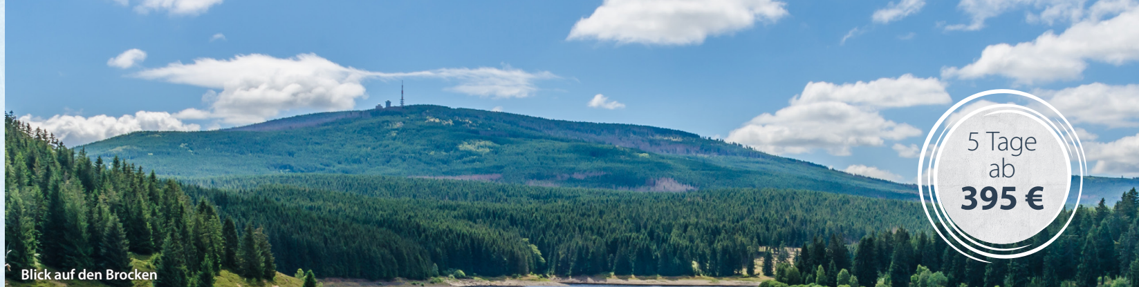
Blick auf den Brocken