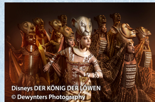
Disneys DER KÖNIG DER LÖWEN

2. Tag: Fischmarkt – Stadtrundfahrt – Heimreise Heute heißt es früh aufstehen, damit Sie noch rechtzeitig zum beliebten Fischmarkt kommen. Anschließend beginnt Ihre Stadtrundfahrt. Sie besuchen die Alt- und Neustadt mit dem Jungfernstieg, dem Rathausmarkt, der Börse und der St. Michaeliskirche, deren Turm das Wahrzeichen Hamburgs ist. Die Kramer-Amtswohnungen, St. Pauli und die Speicherstadt bleiben Ihnen natürlich nicht vorenthalten. Im Anschluss haben Sie noch die Möglichkeit zu einer Hafentrundfahrt (Extrakosten). Anschließend treten Sie vorbei an Hannover Ihre Rückreise an.