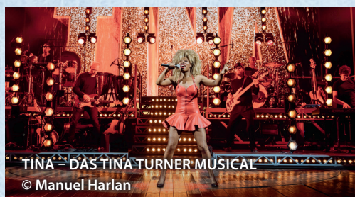
TINA – DAS TINA TURNER MUSICAL

Zauberhafte Melodien, berauschende Tänze und spannungsreiche Geschichten sind den Hamburger Musicals zu eigen. Die Hansestadt zählt zu den bedeutendsten Musicalstandorten Deutschlands. Seit Jahrzehnten werden Bühnenstücke von Weltrang aufgeführt, neue Spielstätten wurden eröffnet, um der großen Nachfrage gerecht zu werden. Tauchen Sie ein in eine magische Welt mit wilden Tieren oder wohnen Sie leidenschaftlichen Romanzen bei.