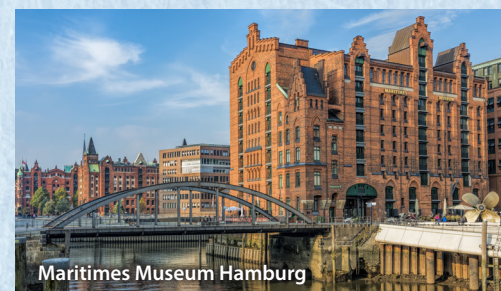
Maritimes Museum Hamburg

2. Tag: Fischmarkt – Stadtrundfahrt – Heimreise Heute heißt es früh aufstehen, damit Sie noch rechtzeitig zum beliebten Fischmarkt kommen. Anschließend beginnt Ihre Stadtrundfahrt. Sie besuchen die Alt- und Neustadt mit dem Jungfernstieg, dem Rathausmarkt, der Börse und der St. Michaeliskirche, deren Turm das Wahrzeichen Hamburgs ist. Die Kramer-Amtswohnungen, St. Pauli und die Speicherstadt bleiben Ihnen natürlich nicht vorenthalten. Im Anschluss haben Sie noch die Möglichkeit zu einer Hafentrundfahrt (Extrakosten). Anschließend treten Sie vorbei an Hannover Ihre Rückreise an.