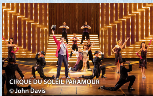
CIRQUE DU SOLEIL PARAMOUR