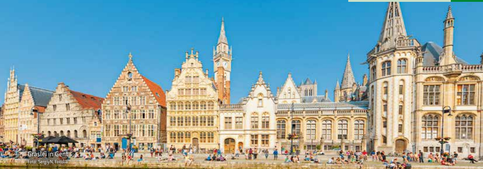
Graslei in Gent