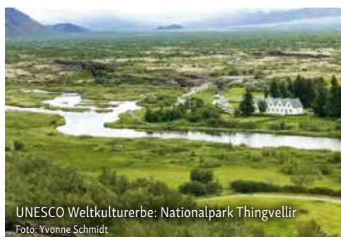
UNESCO Weltkulturerbe: Nationalpark Thingvellir

Auf Island liegen Feuer und Eis dicht beieinander. Vermutlich ist es genau diese Symbiose, die schon das Temperament der Wikinger in Wallung brachte – ganz ohne Met. Und auch Sie brauchen für die Ekstase keinen Energydrink.