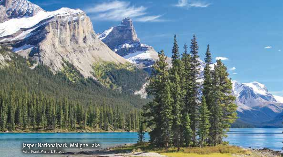
Jasper Nationalpark, Maligne Lake