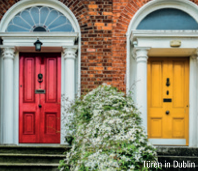
Türen in Dublin