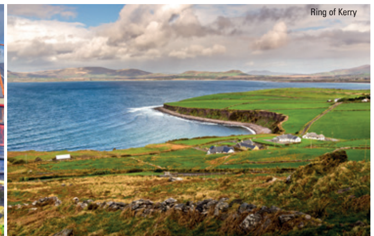
Ring of Kerry